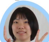
幼児教育学科3年生